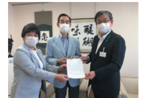
共産党議員団が市長に申し入れ

②では、亀山市の水道の基本料金は県下でも安いので、ほんのわずかとなりますが、家にいる時間が増え水道光熱費がかさむとの声もあり、すべての市民に対する支援として提示しました。その他市民の声を伝え多岐にわたり懇談しました。これからも状況はどんどん変わってきますので、情報を収集し市民の声を聴き伝える大切な仕事をていねいにしていきます。